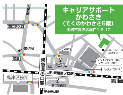
○JR「武蔵溝ノ口駅」、東急「溝の口駅」徒歩5分

【所管】川崎市経済労働局労働雇用部(※本事業は川崎市の委託によりパーソルテンプスタッフ株式会社が実施します。)